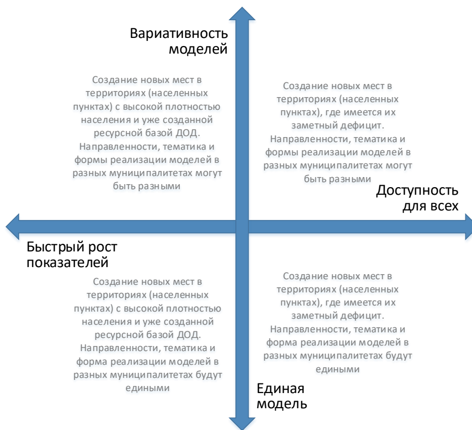
Рис. 4. Шкалы выбора модели создания новых мест с учетом актуальной управленческой политики