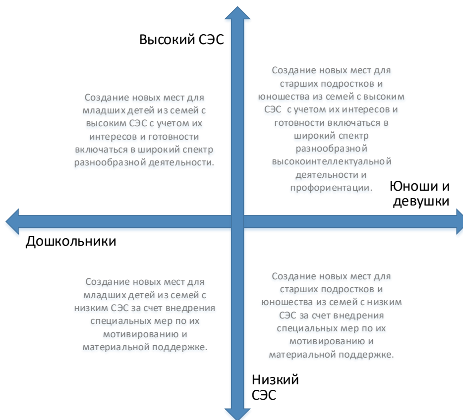
Рис. 5. Шкалы выбора модели создания новых мест по программам художественной направленности с учетом особенностей контингента обучающихся

Вовлечение в программы детей из семей с низким образовательным и культурным уровнем потребует осуществления определенных PR-шагов, поиска мотиваторов для данных детей, в том числе, материальных.