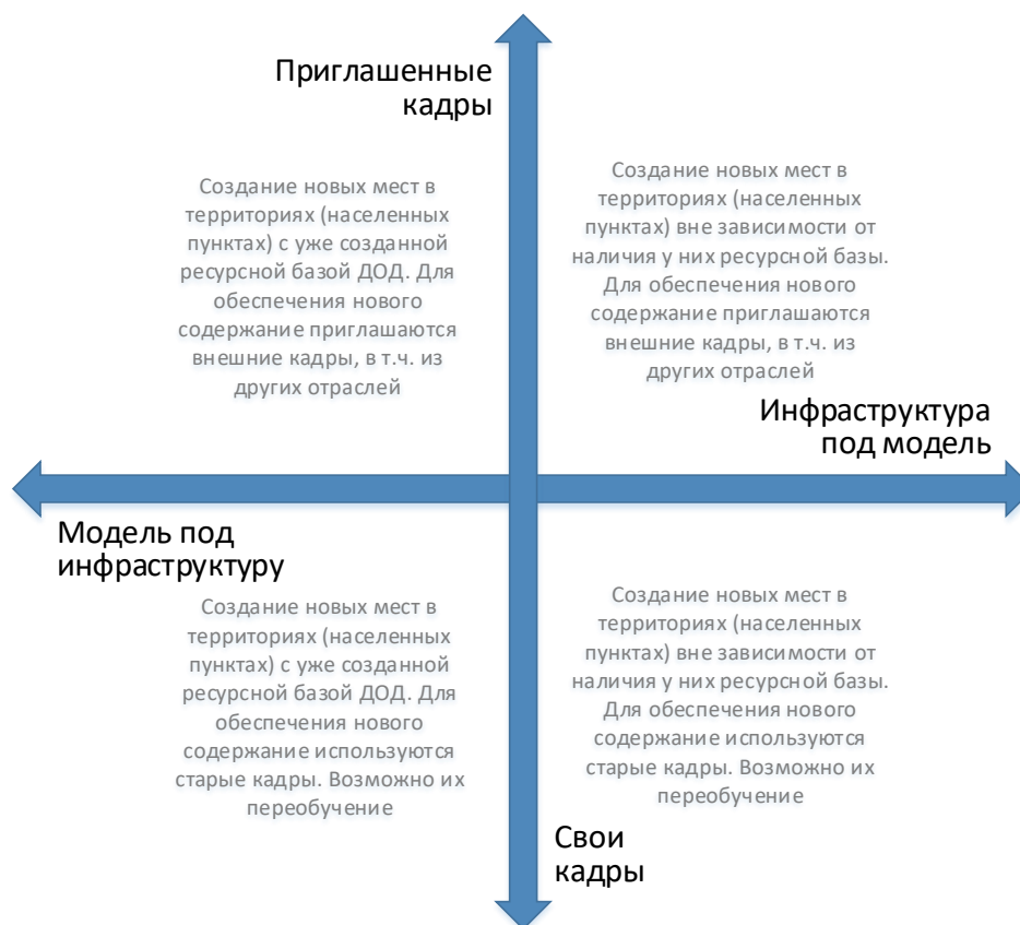
Рис. 6. Шкалы выбора модели инфраструктурного и кадрового обеспечения для типовой модели создания новых мест дополнительного образования

Следует отметить, что механизмы инфраструктурного и кадрового обеспечения не существуют в их полярных вариантах. Решения даже в рамках реализации одной модели будут различны. Анализ перечисленных выше характеристик позволяет сделать эти точечные решения более точными и эффективными.