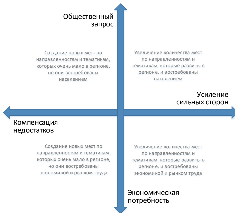
Рис. 2. Шкалы выбора тематики и тактики создания новых мест дополнительного образования