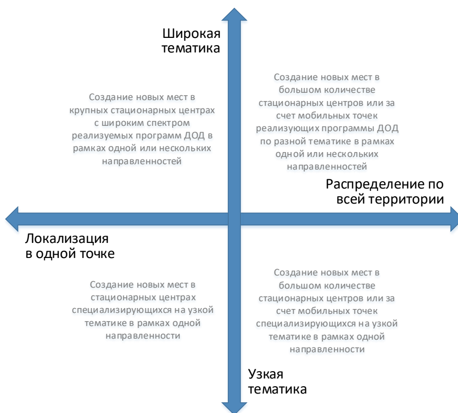
Рис. 3. Шкалы выбора масштаба и формы реализации новых мест по программам ДОД

При невыполнении хотя бы одного из них возникает необходимость пространственного распределения реализуемой модели через мобильные или сетевые решения.